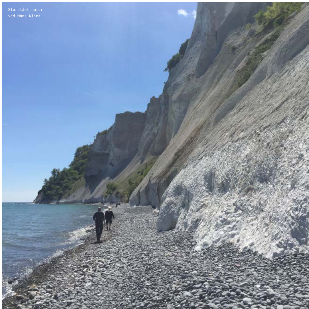
Storslået natur ved Møns Klint.