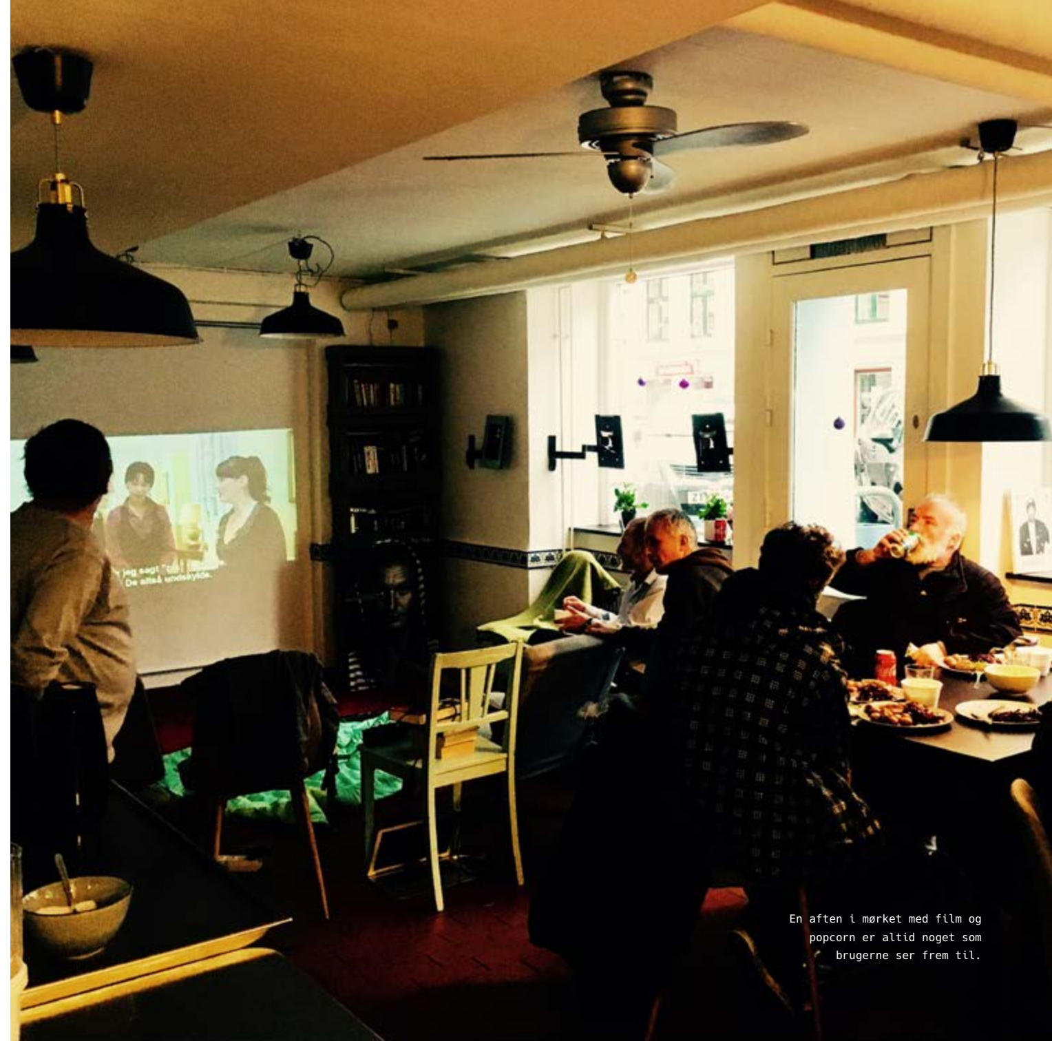
En aften i mørket med film og popcorn er altid noget som brugerne ser frem til.

Det er vores erfaring, at det udligner den magtbalance der uundgåeligt opstår, når forholdet bygger på, at én yder hjælp og en anden modtager. Ved projekterne oplever ansatte og deltagere, at alle kan byde ind med deres unikke viden eller evne og vi bliver påmindet om de mange skjulte ressourcer hos de hjemløse, som vi ikke oplever til dagligt. De hjemløse oplever samtidigt at socialarbejderne ikke altid er eksperterne og også har brug for gode råd eller hjælp til at opnå et bedre resultat, og det er givende for relationen.