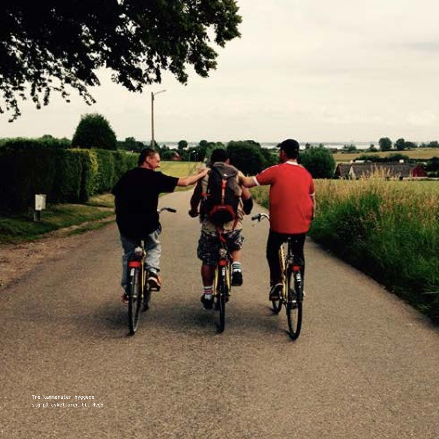
Tre kammerater hyggede sig på cykelturen til Hven