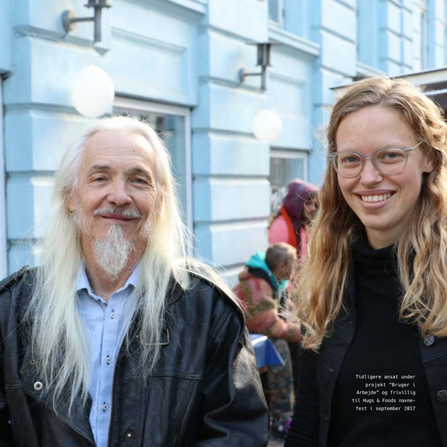
Tidligere ansat under projekt "Bruger i Arbejde" og frivillig til Hugs & Foods navnefest i september 2017