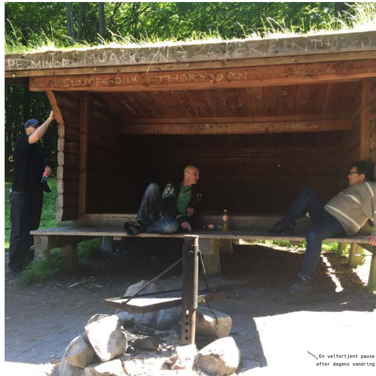
En velfortjent pause efter dagens vandring