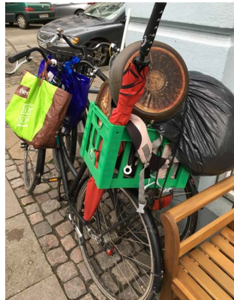
De fleste af brugerne hos Hugs & Food overnatter uden-dørs hele året rundt. Her har en bruger parkeret sin cykel med alle sine ejendele ude foran værestedet på hjørnet af Nansensgade og Turesensgade 21.