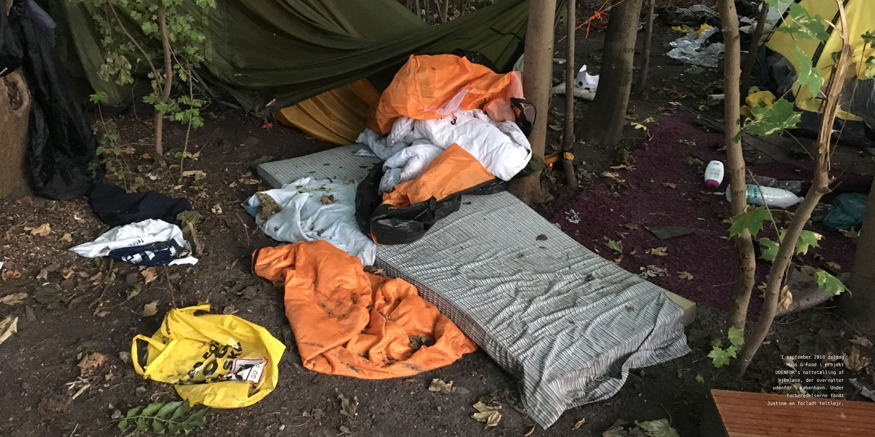
I september 2018 deltog Hugs & Food i projekt UDEFOR's nattetælling af hjemløse, der overnatter udenfor i København. Under forberedelserne fandt Justine en forladt teltlejr.