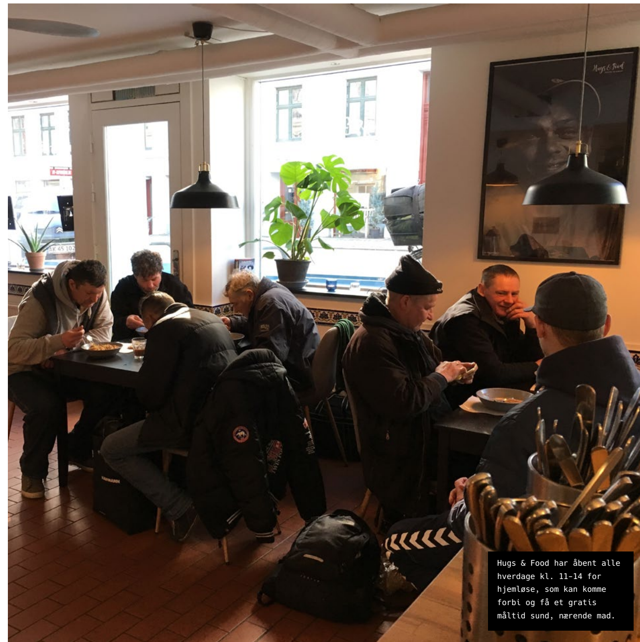
Hugs & Food har åbnet alle hverdage kl. 11-14 for hjemløse, som kan komme forbi og få et gratis måltid sund, nærende mad.