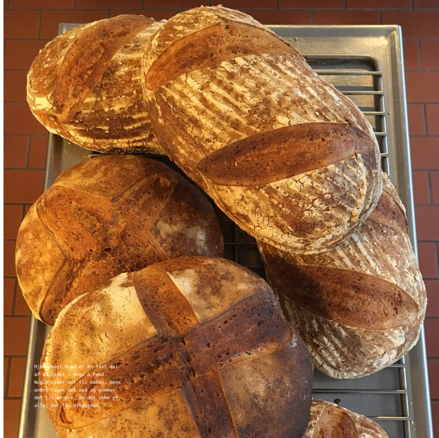
Hjemmebagt brød er en fast del af måltidet i Hugs & Food. Nogle nyder det til maden, mens andre tager det med og gemmer det til senere, da det ikke er alle, der får aftensmad.

For mig er brød en hel verden for sig selv, og det kan noget, som ingen anden madvare kan. Godt brød spreder en meget speciel form for glæde hos os alle