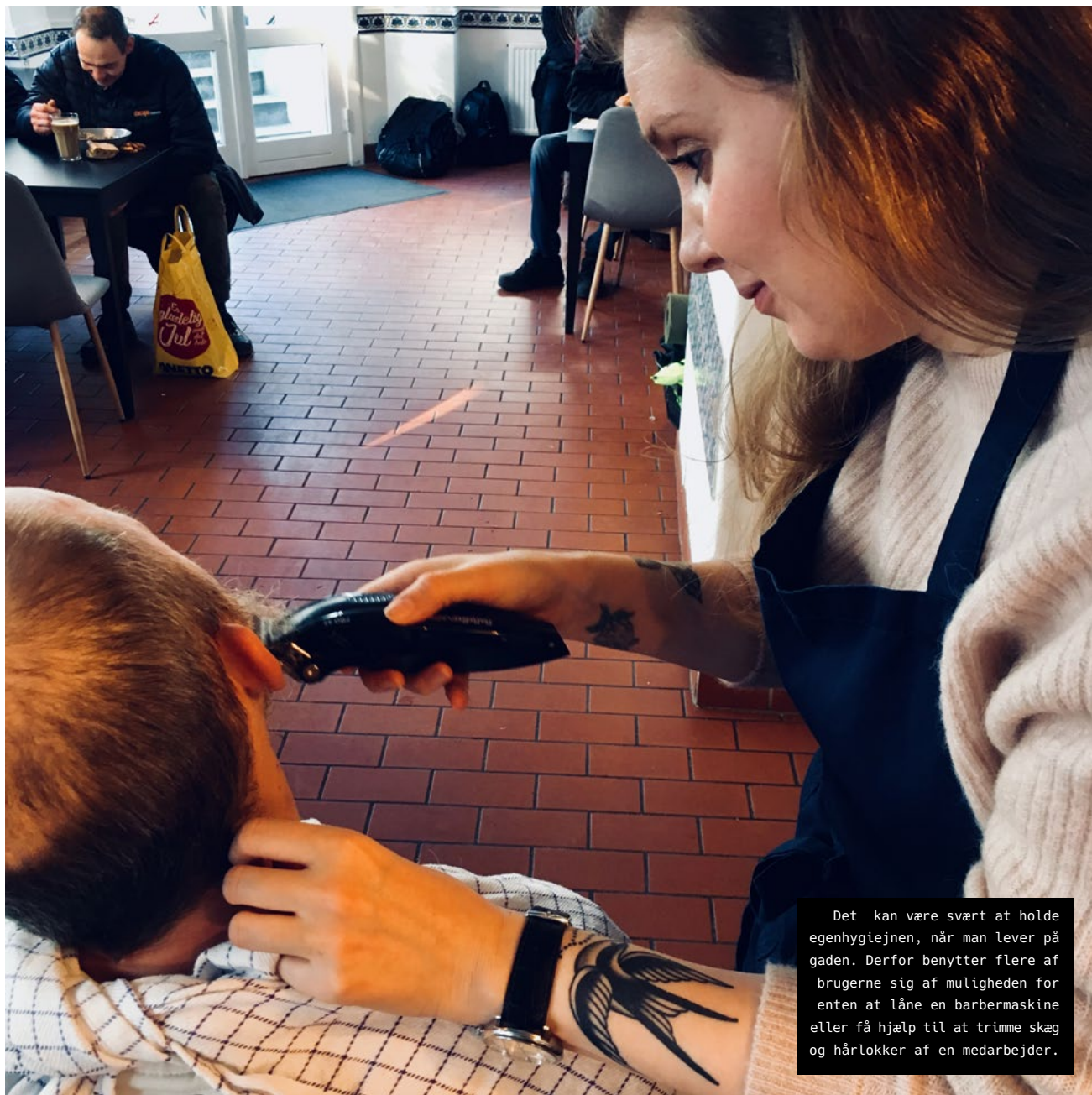
Det kan være svært at holde egenhygiejnen, når man lever på gaden. Derfor benytter flere af brugerne sig af muligheden for enten at låne en barbermaskine eller få hjælp til at trimme skæg og hårløkker af en medarbejder.