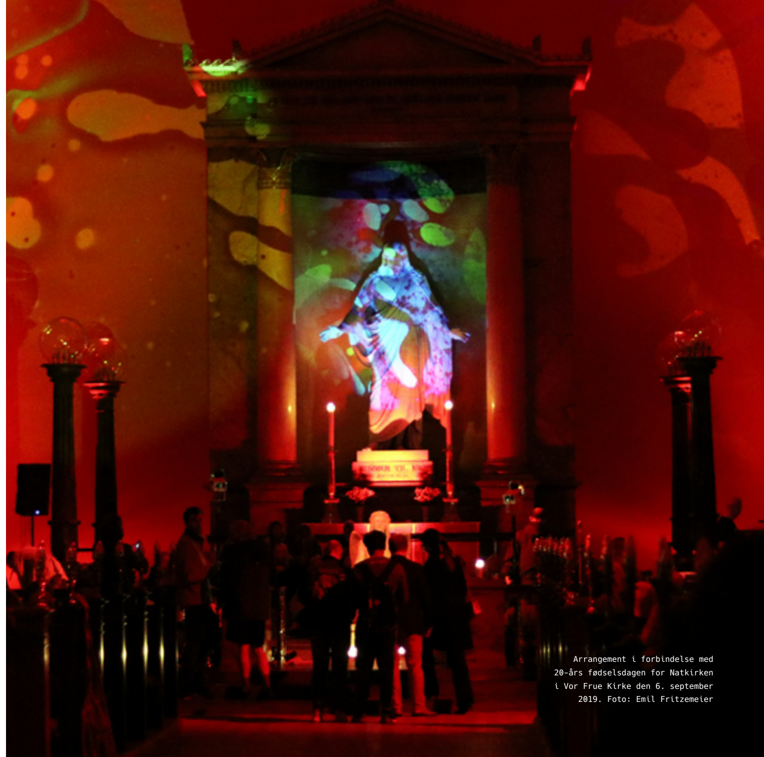
Arrangement i forbindelse med 20-års fødselsdagen for Natkirken i Vor Frue Kirke den 6. september 2019.

Hugs & Food er organiseret under Vor Frue Kirke i København og er bl.a. finansieret af midler fra Vor Frue kirke og andre kirker i indre by. Bag Hugs & Food er således et udvalg, der består af repræsentanter fra henholdsvis Vor Frue Kirke, Garnisons Kirke, Helligåndskirken, Trinitatis Kirke og Sankt Petri Kirke.