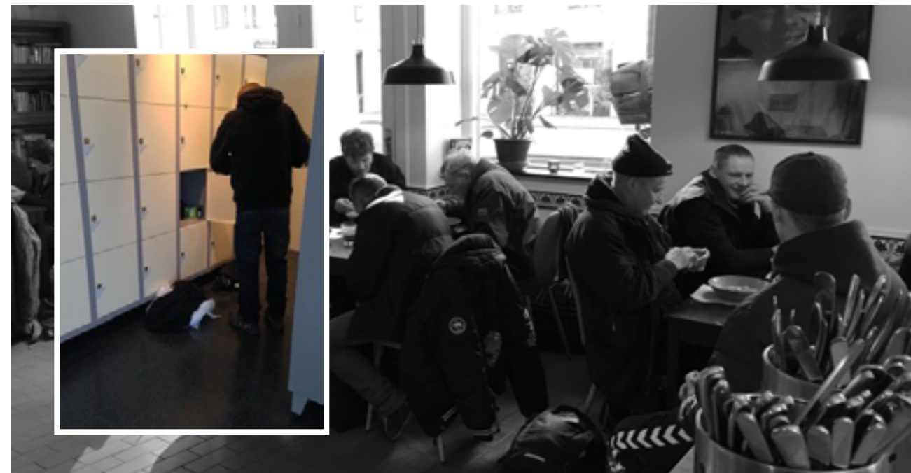
Formålet med Locker Room er at tilbyde ukompliceret og sikker opbevaring af hjemløses ejendele i samspil med andre socialfaglige indsatser såsom rådgivning, risikovurdering, og brobygning til andre aktører - heriblandt Hugs & Food.

Projekt UDENFOR og Hugs & Food er tætte samarbejdspartnere. Har projekt UDENFOR en bruger, der mangler et par støvler i en størrelse,